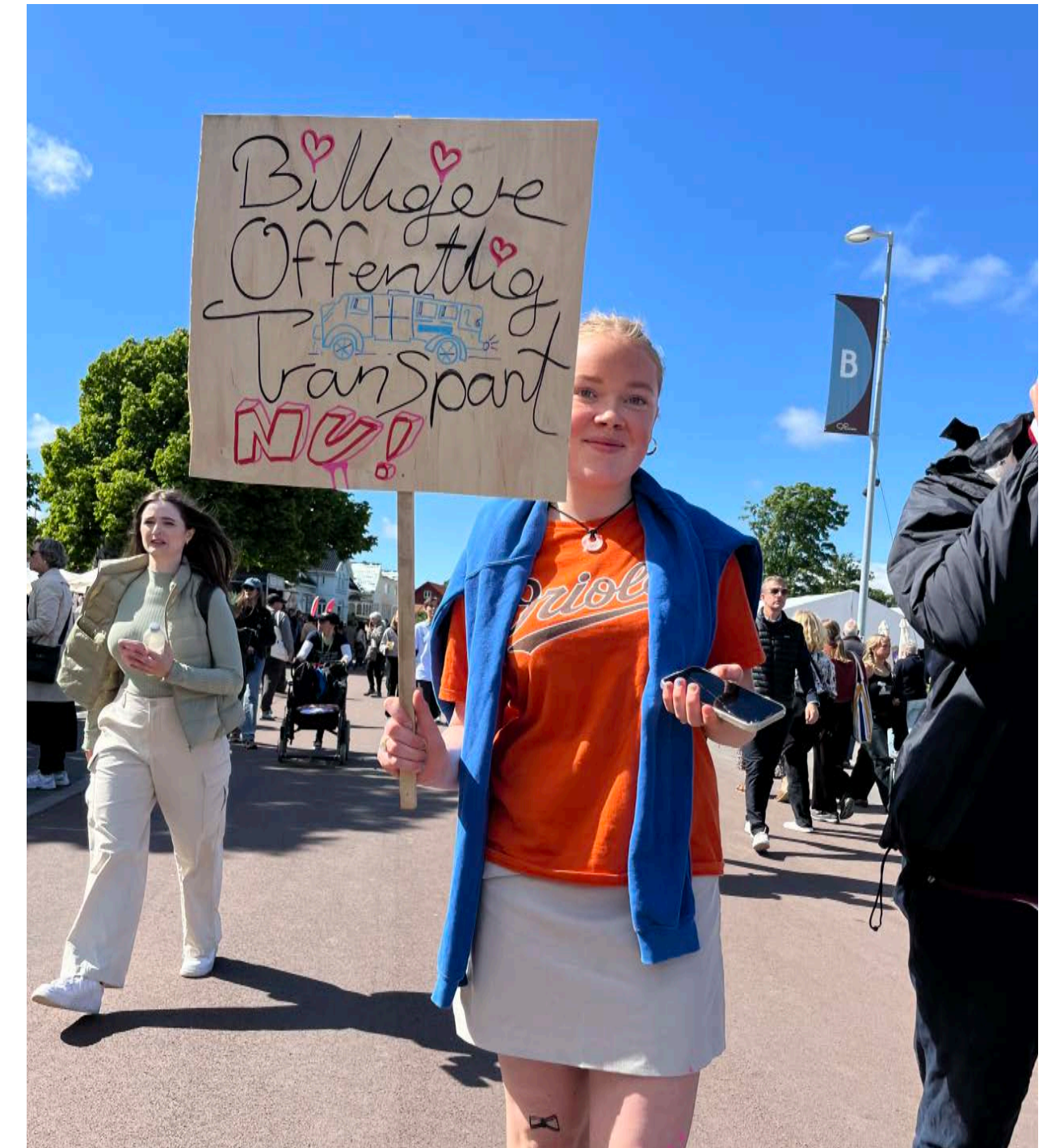
DEMOKRATIVÆRKSTED PÅ UNGDOMMENS PLADS